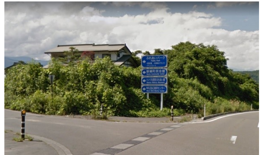
(a) 北国街道(県道 60 号) T字路左折