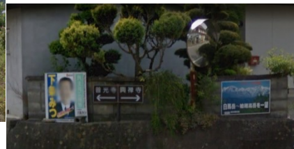
(5) Y字路右方向へ登る(伊切方面)