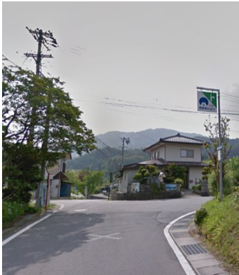
(3) Y字路右方向へ(興禅寺方面)