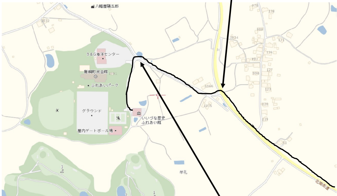
(b) いづな歴史ふれあい館など入口 左折