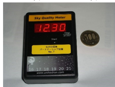
スカイクオリティメーター

測定は、頭の真上(天頂)に向けて、ボタンを押すだけで瞬時に夜空の明るさが表示されます。同一地点で3回計測します。